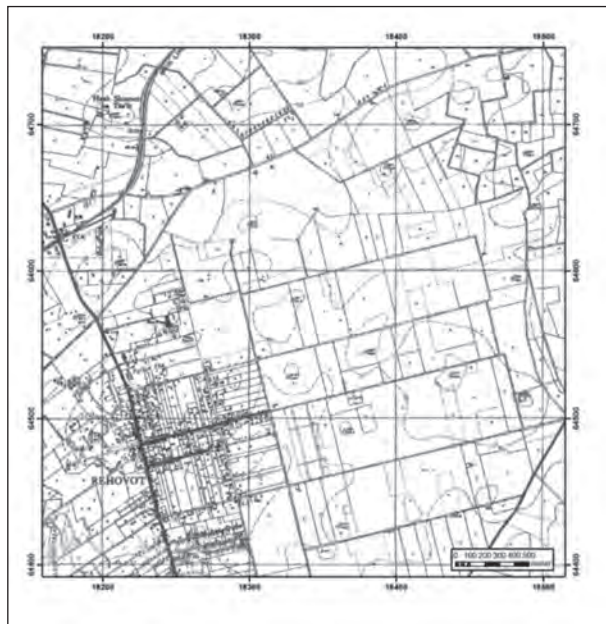
איור 2: שטחי הפרדסים ממזרח למושבה רחובות, 1942

בילמס לאחרים במחיר גבוה ממחיר הרכישה, לאחר שנוכח בביקוש הגדל לקרקעות לנטיעת פרדסים. בילמס עצמו, לא עלה לארץ ישראל והוסיף להתגורר באנגליה, משם ניהל את השקעותיו בארץ ישראל, דאג לבניית המתקנים החקלאים, לנטיעת הפרדסים ולעיבודם.