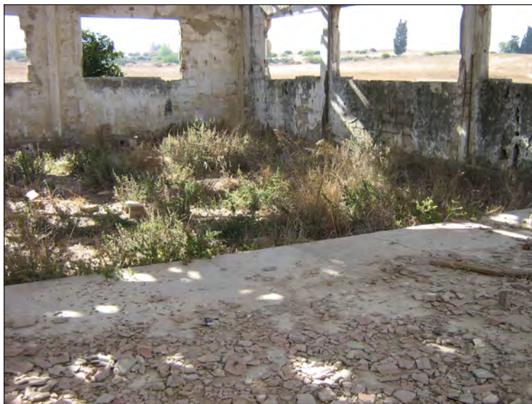
איור 7: תצלום הרצפה בתוך בית האריזה. לצד רצפת בטון מוגבהת ניתן להבחין בקרקע חשופה שבעבר הונחה עליה רצפת עץ מוגבהת. מתחת לגובה מפלס רצפת העץ ובתוך הקירות מבחינים בפתחי אורור מלבניים