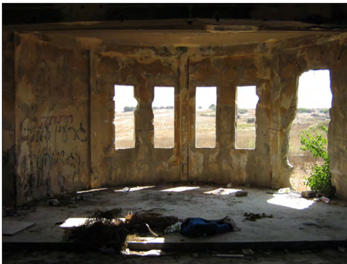
איור 10: תצלום מבט לתוך בית הבאר

3. הצגה של הבחנות תפקודיות והגדרה של 'תפקודים ראויים' למפגש המתקיים בין נכס מורשת תרבות לשטח פתוח ערכי. בתפקודים אלה כלולים תפקודים שלפיתוחם נדרשת התערבות מזערית בנכס ובסביבתו, בשונה מהתערבות גבוהה, כמו מלונאות, תפקוד אותו ציינה תמ"א 12 בשינויים שנוספו לתכנית ואושרו בשנת 2011. הבחנה שכזו מקדמת הגדרה של תפקוד התורם לחוויית המקום והנוף הייחודי, מבדילה אותו בין 'תפקוד נלווה לתפקוד החווייתי שנהנה מהערך המוסף הקיים בנכס ובנוף הערכיים. תפקוד שכזה יכול להתמקם באזור המוגדר צמוד דופן, אזור חץ, או בתוך מרקם מיועד לפיתוח שבגבולות השטח המוכרז. התפקוד הנלווה, גם אם הוא נדרש להשקעה גבוהה, תועלתו הכלכלית גבוהה משום שהוא נועד לא רק לאוכלוסייה הנהנית מחוויית הפנאי והנופש בשטח הפתוח אלא לאוכלוסייה רחבה יותר.