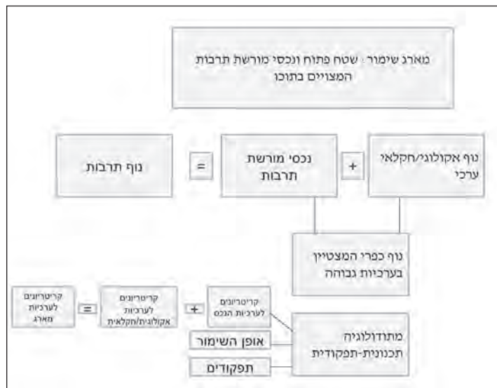
איור 11: מארג מוטה שימור: מתודולוגיה לבחינת ערכיות וקביעת אסטרטגיה תכנונית-תפקודית

לקריטריונים התרבותיים והנופיים שזכו להסכמה רחבה ופורסמו במסמכים שונים ניתן לצרף הבחנות הקשורות בארגון המרחב המשולב: מקבץ נכסי תרבות או ריכוז של תופעות אקולוגיות; המופע במרחב, הבולטות והצורה של נכסי התרבות או היחידות הנופיות; נדירות התופעות, התרבותיות או האקולוגיות; מגבלות פיתוח - פיסיית (ריחוק או קרבה לתשתיות, תנאי קרקע), כלכליות וסטטוטוריות (בעלות על הקרקע, צמידות דופן או סמיכות לאזור חיצ).