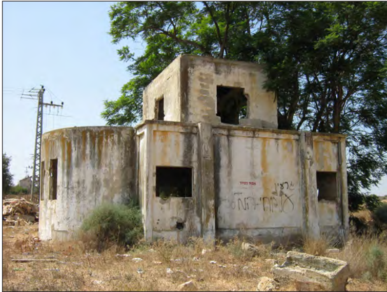
איור 4: תצלום הבאר, מבט ממזרח. בעבר, גג הקומה השנייה שימש לבילוי חברתי וסביבו נבנה מעקה ברזל