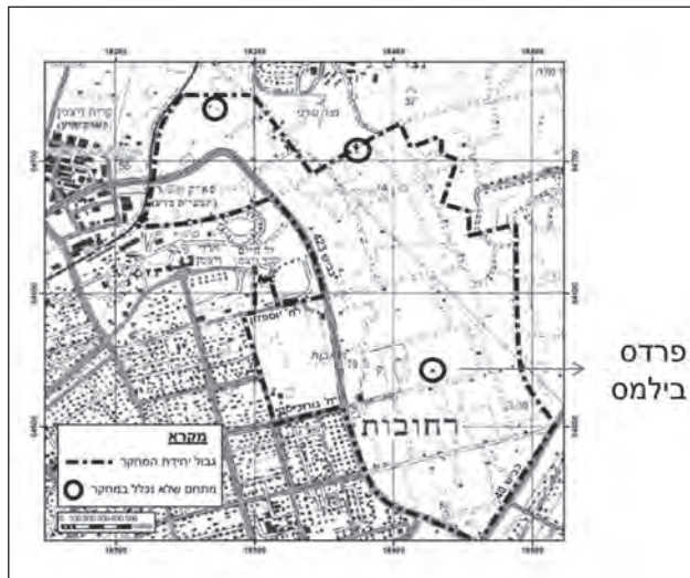
איור 1: גבולות יחידת המחקר ממזרח לרחובות: שטח פתוח ונכסי מורשת בנויה

ותפיסתה הכלכלית-ציונית בשנות העשרים והשלושים (נכונות להשקיע בארץ ישראל כדי להפכה למרכז כלכלי, אך לא להתיישב בה, Amit-Cohen 2012); אופייניות – המרכיבים הפונקציונאליים והאלמנטים האדריכליים חושפים טכנולוגיות, חומרי בניין וסגנון שאפיינו את מבני הפרדס ברחובות, אך גם באזורים אחרים במישור החוף המרכזי (ויטריאול 2010). למאפיינים אלה חשיבות נוספת, השתקפותם של תהליכים כלכליים, חברתיים, תרבותיים וגיאוגרפיים בנכסים, כמו: השאלת רעיונות טכנולוגיים מחו"ל והתאמתם לתנאי ארץ ישראל; השלכות רגיונאליות - מסלע, קרקע, משטר מים, אקלים על בחירת המתקנים החקלאיים, השימוש בחומרים ובשיטות בנייה; אימוץ שיטות בנייה מקומיות; המעמד החברתי-כלכלי של המשקיע וביטוי בנכסים; המיקום ומערך הדרכים והמים וההשלכות על מאפייני המבנים והמתקנים החקלאיים; אירועים היסטוריים ודמויות רבות השפעה שנקשרו בנכסים ועוד ועוד (Amit-Cohen 2012; ויטריאול 2010); ריכוז – לקבוצת המבנים במתחם בילמס נושא משותף והיא בולטת בתוך הסביבה הנופית; השתמרות – מצב פיסי בינוני המאפשר את ייצוב המבנים ואת שחזור המתחם; מיקום ומעמד סטטוטורי – המקבץ ממוקם ממזרח לרחובות, בשטח פתוח מוכרז. על פי תמ"מ 21/3 הוא משתייך להגדרה של אזור חקלאי או נוף כפרי פתוח, ועל פי תמ"א 35 הוא חלק מ'מרקם שימור משולב'. דרך כורכר כבוש מחברת בינו לכביש עוקף רחובות הנמצא ממערב לו ולכביש 40 במזרחו.