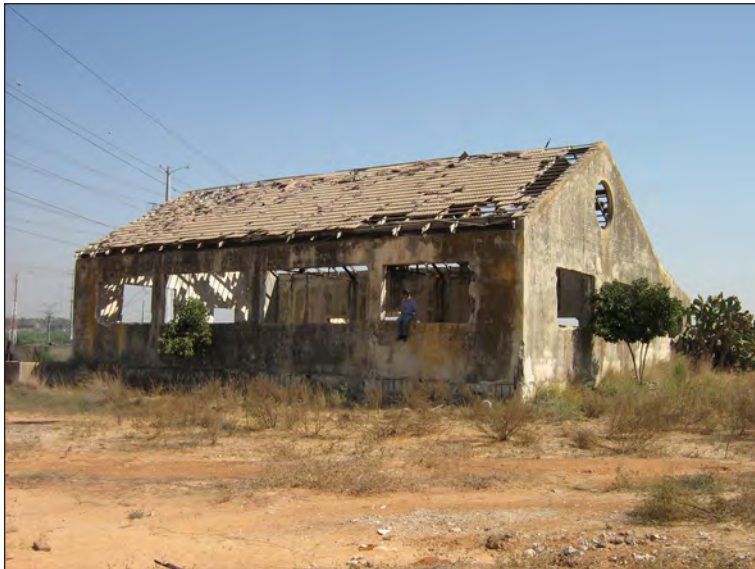
איור 5: תצלום בית האריזה, מבט מצפון צפון מערב