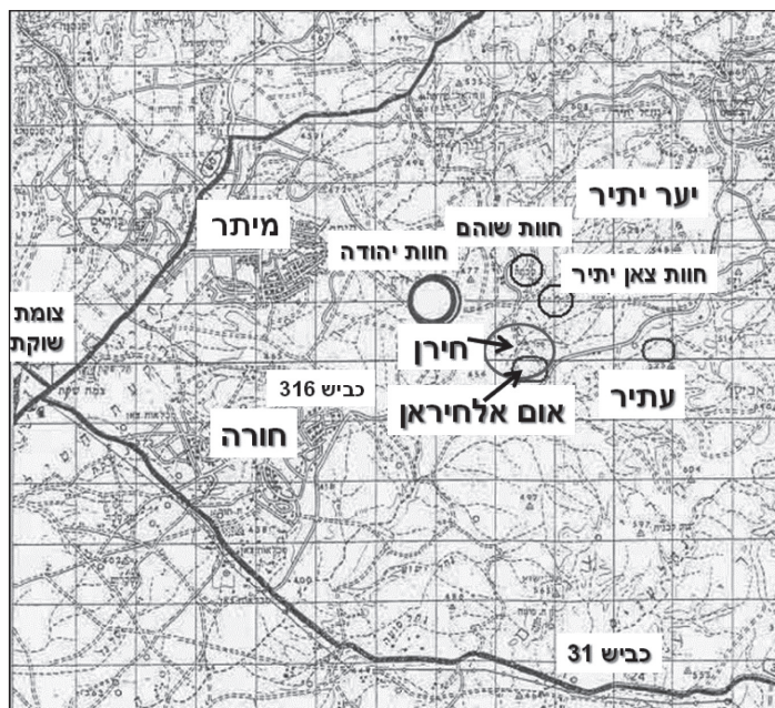
איור 1: המיקום של אום אלחיראן, עתיר, חירן וחוות בודדים מקור : חמדאן, 2005 עמ' 6.

עתי/אם-אלחיראן - הוא כפר לא מוכר של עקורי פנים, המונה כ-1,000 נפש וממוקם בשטח גלילי בנחל יתיר, מזרחית למיתר. אחרי שקמה ישראל, קיבלו בני השבט צו מהממשל הצבאי לעזוב את מושבם המקורי באזור ואדי זובאלה, ולעבור לאזור ח'רבת אלהוזייל, משם הצטוו לעבור לאזור קיבוץ להב, ובשנת 1956 הועברו באופן סופי וקבוע לאתרם הנוכחי, שם הותר להם לרעות ולעבד כ-7,000 דונם. מ-1963 העבירה המדינה חלק מהאדמות החקלאיות שהועמדו לרשות הכפר לידי הקק"ל ובשנות השמונים הופסקו חוזי החכירה, ומרבית הקרקעות הועברו לפרויקט הייעור. 9