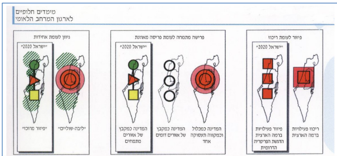
איור 1: ממדי ארגון המרחב של ישראל 2020

ישראל 2020 זכתה לדברי הלל רבים על השיטה, התוכנית ושפתה החדשה. 'ישראל 2020' נחשבת, כפי שאלתרמן (2020, עמ' 63) סבורה, כ"מסמך התיכנון השאפתני ביותר אשר חובר אי-פעם בישראל ויכול לתפוס מקום מכובד גם