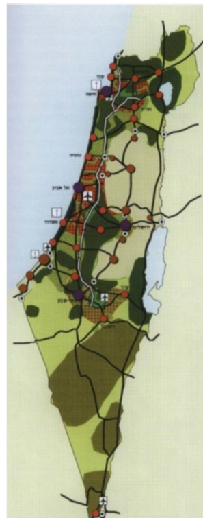
איור 2: תכנית אב לארגון המרחב הלאומי

ניתוח זה מראה עם כן את הדיסוננס הקיים בין הקריטריונים והיעדים שהם מבטאים ובין התשריט הסופי של התוכנית. בסופו של דבר, התשריט הסופי מבטא ארגון מרחבי מועדף לא מעבר לכך, כפי שמראה איור מס' 2.