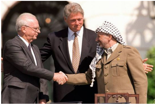
יצחק רבין, יאסר ערפאת וביל קלינטון בחתימת הסכם אוסלו. 13 בספטמבר, 1993.

סביר, היווה אחד הקטליזטורים להתכנסות התכנונית וליווה את הפרויקט לאורך רוב שנותיו.