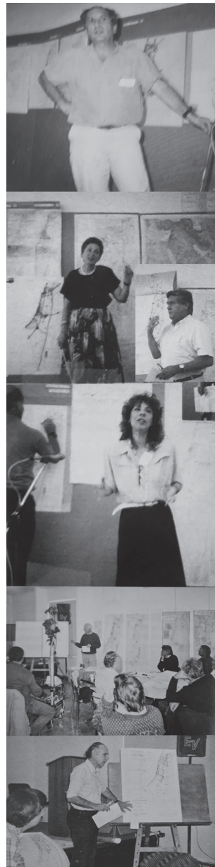
תמונות מסדנת החלופות שהתקיימה בפקולטה לארכיטקטורה בטכניון ביום 24.6.1991 (פורסמו בדו"ח ב' (1993).

את עוצמת התפנית בחשיבה יש להעריך על רקע התפיסה שרווחה באותה תקופה בה פרחו הבנייה הפרברית - יישובים קהילתיים ומיצפים בכל מקום. דור קודם לכן, פוזרו עיירות הפיתוח ברחבי הארץ, ועוד דור אחורה – ההתיישבות השיתופית (קיבוצים ומושבים) של טרם קום המדינה, שקידמו הסוכנות היהודים והקק"ל. "ישראל 2020" הפכה למעשה על פניה את תפיסת "פיזור האוכלוסייה" ששלטה בתיכנון הישראלי מאז תוכנית אריה שרון בתחילת שנות החמישים. עדיין שלטה התפיסה הוותיקה לפיה יש לבנות ערים ויישובים מפוזרים,