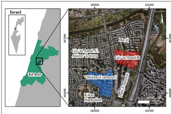
איור 1: מרחב ג'מאסין ושתי השכונות

גבעת עמל ב' (להלן: "גבעת עמל") היא שכונת צריפים אשר נוסדה בשנת 1948 על ידי פליטים יהודים שנקשרו מבתיהם בשכונות הספר הגובלות ביפו (בעיקר שכונות שבזי ומנשייה), עקב הלוחמה העירונית בין היישוב היהודי לערביי ארץ ישראל במלחמת העצמאות. במצוות מוסדות המדינה, שוכנו התושבים נכסי נפקדים נטושים בכפר ג'מאסין המערבי וזאת במטרה למלא משימה לאומית-ביטחונית בהגנה על גבולותיה הטרניים של העיר תל אביב המתרחבת צפונה (גולן, 2001 : 81). למרות האמור לעיל, מאז ועד היום, זכויות המקרקעין של תושבי גבעת עמל לא הוסדרו באופן פורמאלי. כפי שנראה בהמשך, לאורך השנים, חלו שינויים בהגדרת זכויות התושבים ולפרקים הם