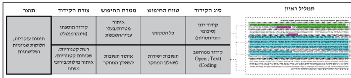
איור 1: סכימת שיטות קידוד