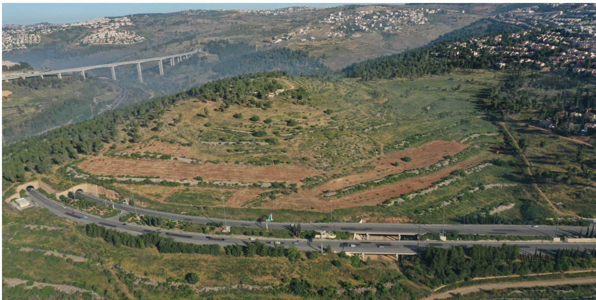
איור 1: מצפה נפתוח, רמות, ירושלים.

מקוצר היריעה, אין אפשרות לפרוס תאור מעמיק של כל אחד ממקרי הבוחן 2 . הממצאים המרכזיים כוללים גם תפיסות בקרב אנשי המקצוע והמדיניות, הפעילים החברתיים ופעילי השכונות, המתארים פחות בציר השימור ההיסטורי